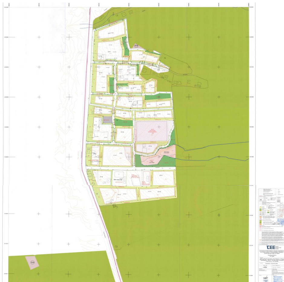
Εικ 1: Η Μ-ΠΕ 1 (Αγία Μαρίνα)

Σύμφωνα με την (η) σχετική, η πρόταση ρυμοτομίας της ΠΕ Αγ. Μαρίνας έχει ως εξής: